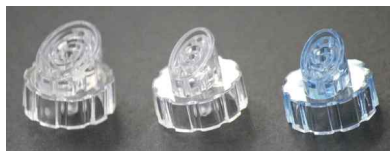
<팁 : 대(大) · 소(小) · 청소용>